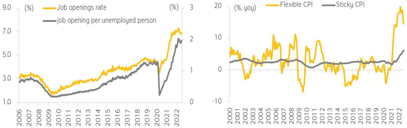
Figure 2: Job market remains too strong which allows inflation to stay sticky